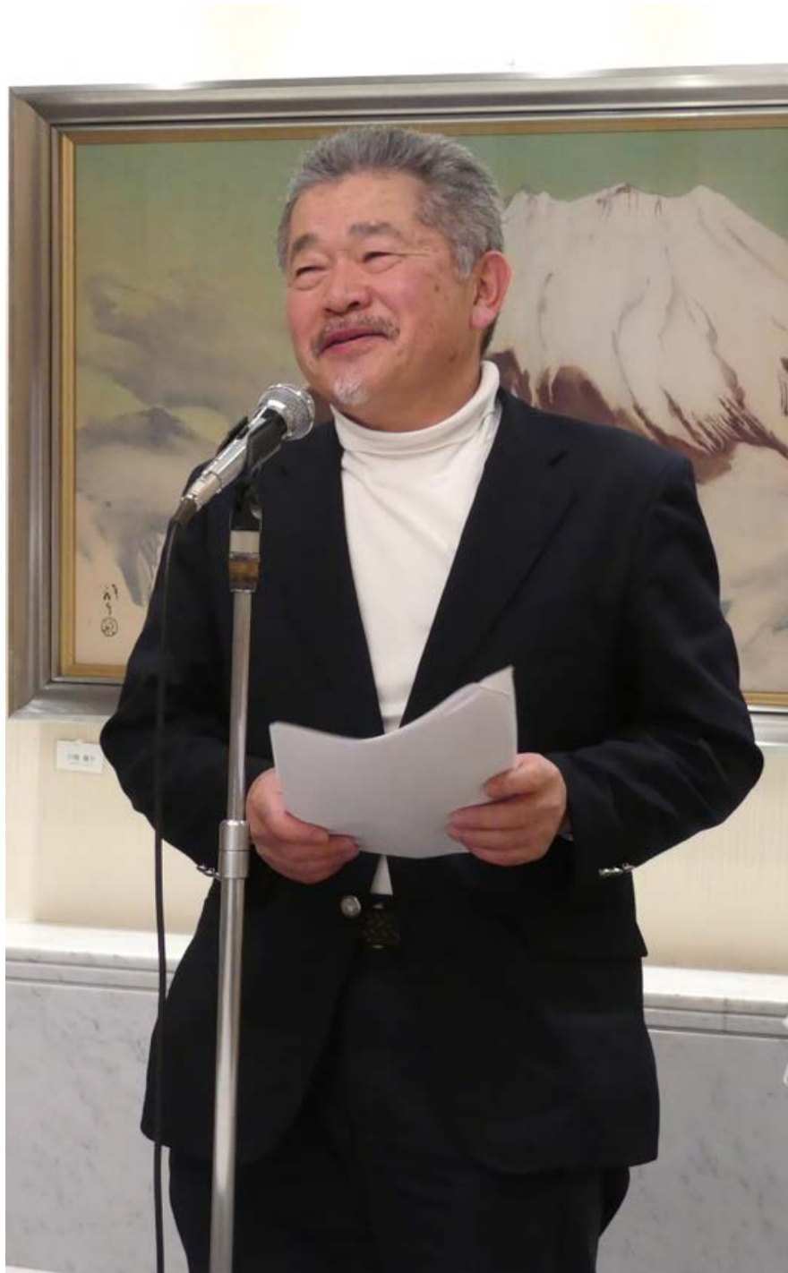
<加藤副幹事長報告>