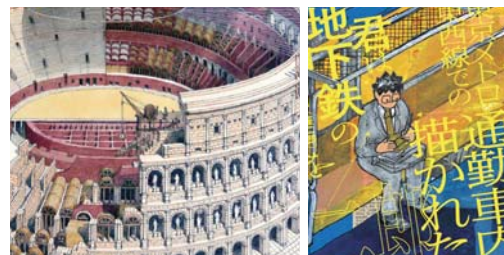
青山邦彦×座二郎 (高橋庸文) 16:30 ~

そして、開店 40 周年を迎える高田馬場のジャズスポット「イントロ」とのコラボです。