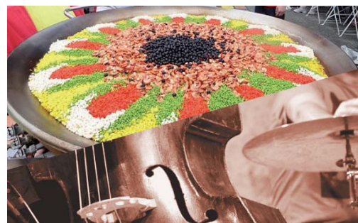
同じ釜の飯とライブ演奏 (画像はイメージです) 17:30 ~

○聞き手 (1~3部とも)：今村 創平・山本 想太郎 (苗 H01 / 平成元年卒業)